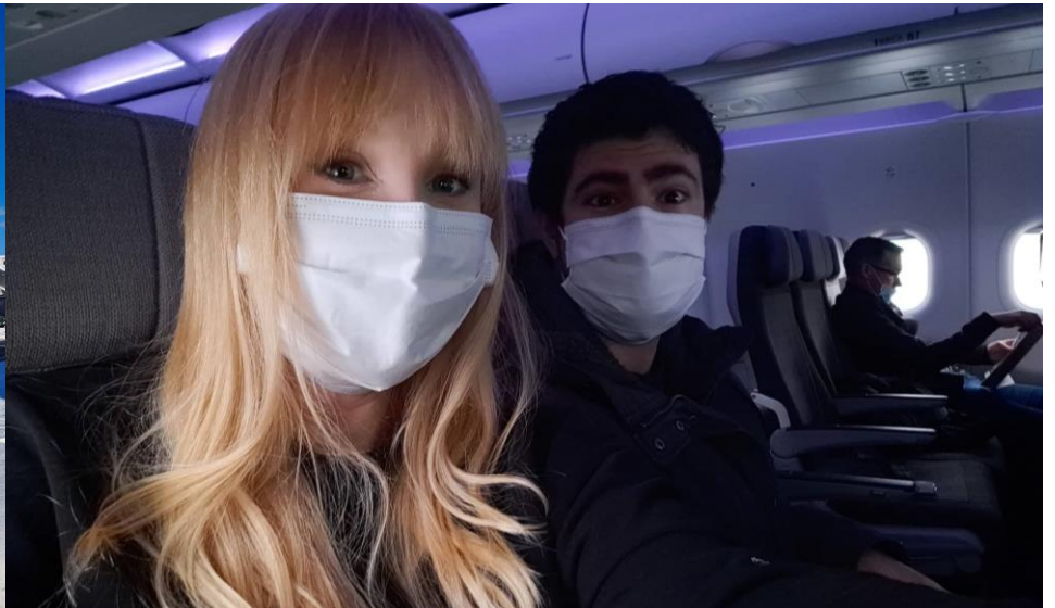
Kaksi iloista matkustajaa jossain Dublinin ja Lontoon välillä, vielä täysin tietämättöminä koronakohtalostaan.