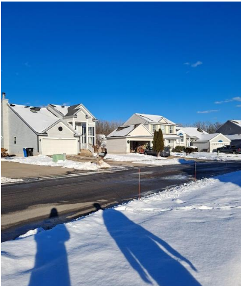
Michiganin talvisäässä on suomifiilistä. Rohkenimme ulos pariin kertaan pahimpien oireiden lievennyttyä

Karanteeniajan vuoksi paluamme Irlantiin myöhästyi usealla päivällä. Tammikuun ensimmäisen sunnuntain iltapäivänä kotiin päästyämme meitä tervehti eteisessä kasa joulupostia ja -paketteja. Kiitos kaikille muistaneille ihanista lahjoista ja korteista! Ne lämmittivät kovasti mieltämme ja olemme kiitollisia kaikista 2021-vuoden aikana luomistamme yhteyksistä ja saamastamme tuesta. Olomme on siunattu!