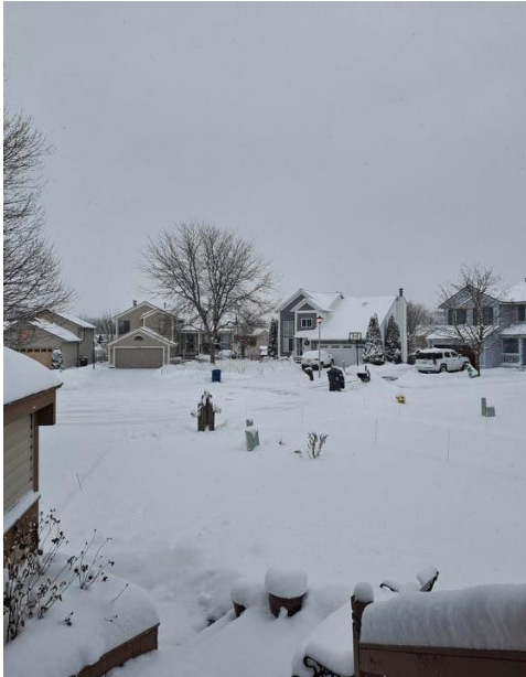
Joulunajan karanteeninäkymät. Harmitti, että ei päästy kunnolla nauttimaan lumisesta talvisäästä.