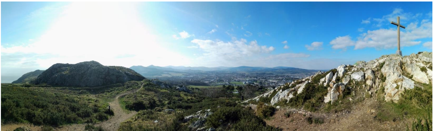
Kuva 1: Kotikaupunkimme läheisellä kukkulalla komeilee iso risti. Se näkyy myös työpöytäni ikkunasta ja muistuttaa siitä, miksi tätä työtä tehdään.

Koko maailma huokailee ja kärsii pandemian vaikutuksista. Miltä maailma tulee näyttämään tämän kaiken jälkeen? Tähän kukaan ihminen ei tiedä vastausta. Mutta niin kuin virressä sanotaan, me voimme luottaa aina Herran rakkauteen ja mitä ikinä tulevat kuukaudet tuovatkaan