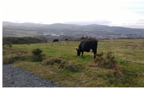
Kuva 3 ja 4: Viikoittaiset, pitkät kävelylenkit ovat olleet henkireikä kokoontumisrajoitusten jatkuessa.